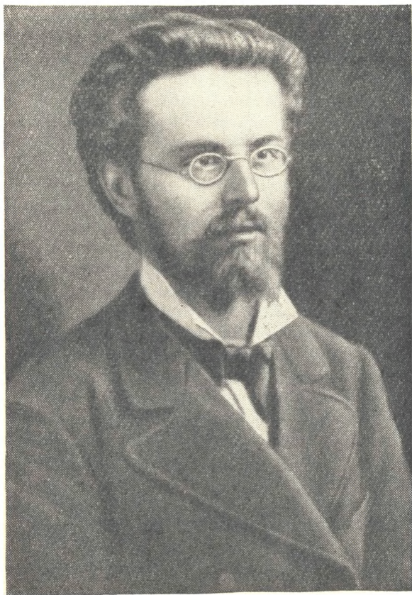
Н. А. Морозов. Фотография середины 70-х годов.